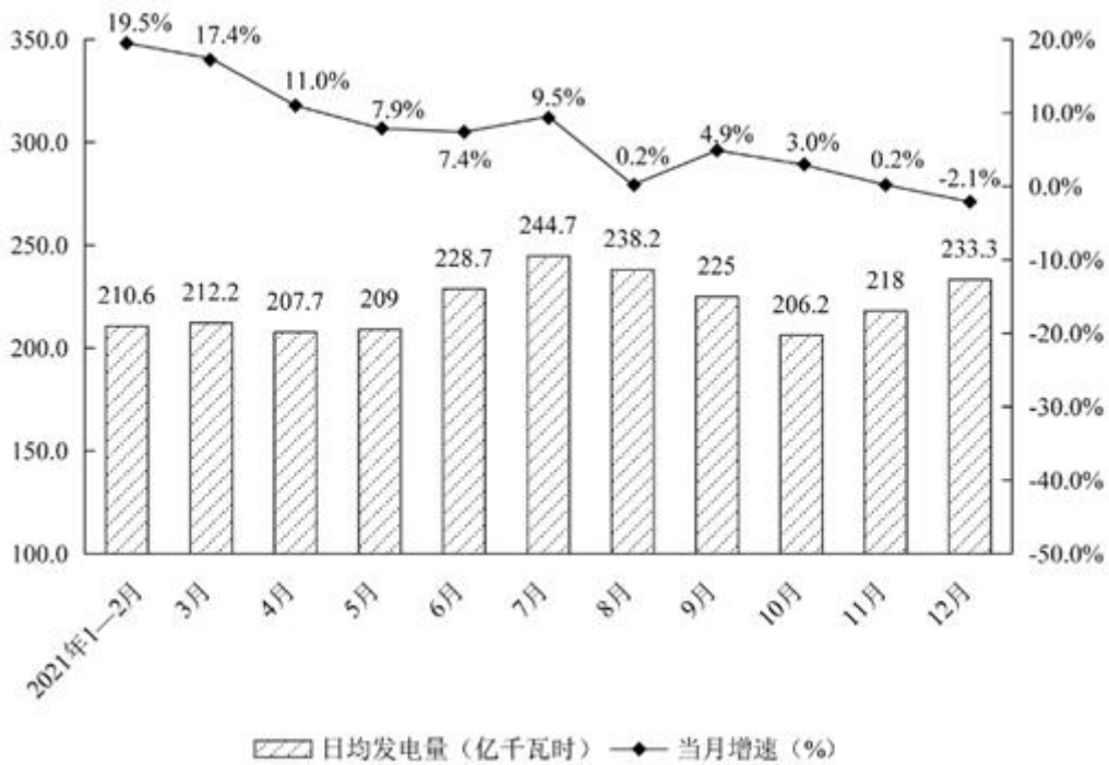
2021 年全国规模以上工业发电量月度走势图

108. 2021 年 1—12 月，日均发电量实现环比增长的月份有（ ）个。（注：1—2 月份合并计算。）